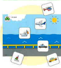
のりものマグネットカード